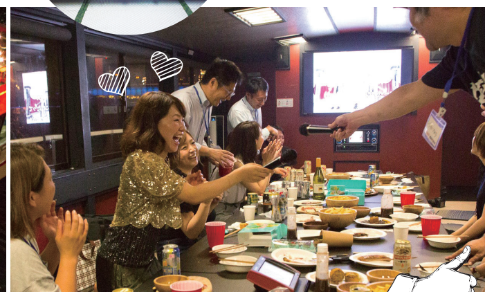
1階ゲストルームは、冷暖房完備でカラオケも楽しめちゃう！！