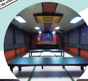
ご利用人数によって、自由に座席レイアウトを変更できる