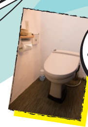
ウオッシュレット完備 キレイなおトイレ！