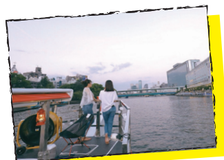
風を感じるロフトデッキ